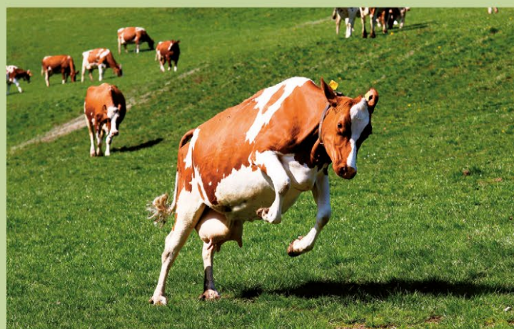
Spaß beim ersten Weidegang nach dem Winter